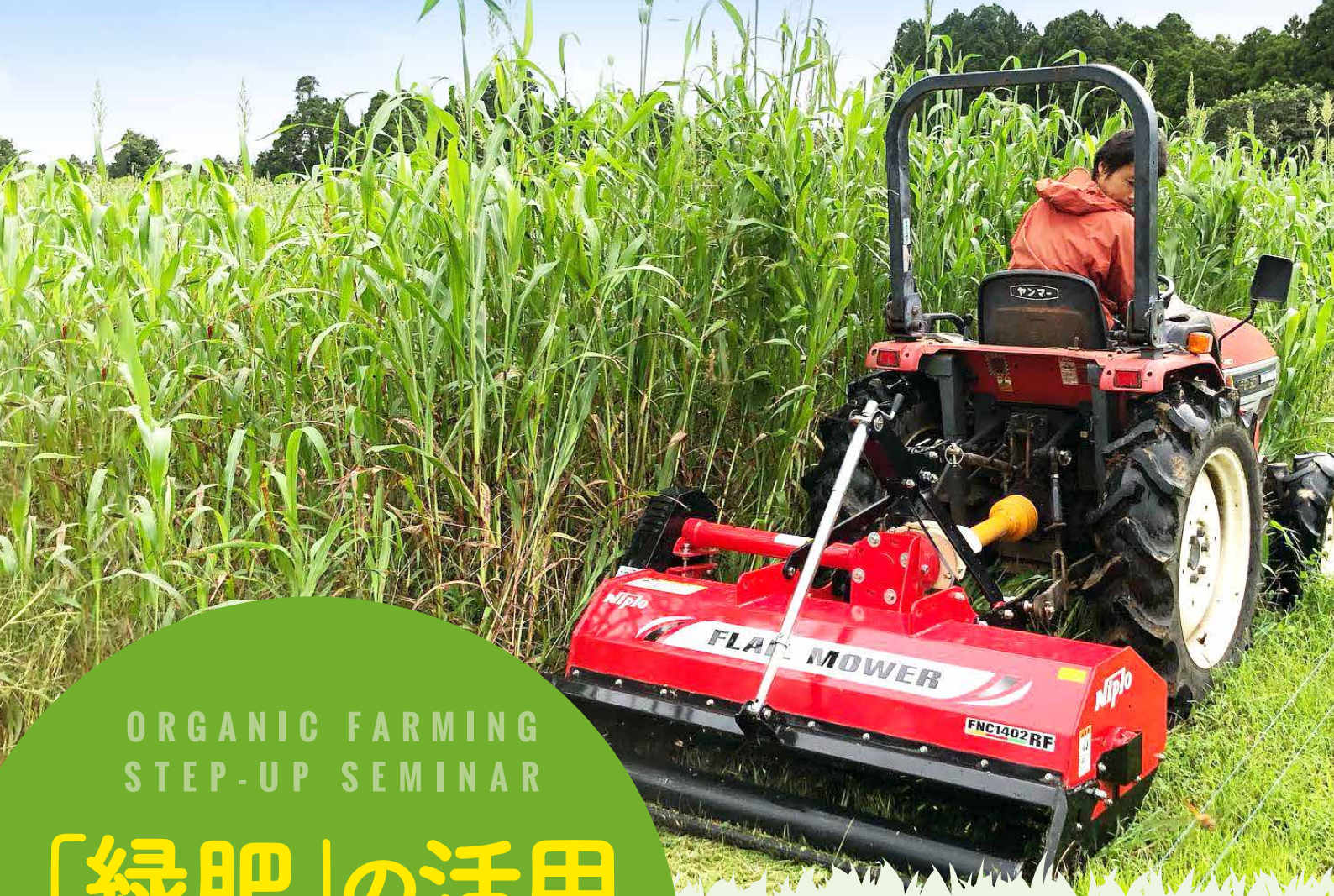
裁断機(フレールモア)による緑肥用ソルガム粉砕の様子